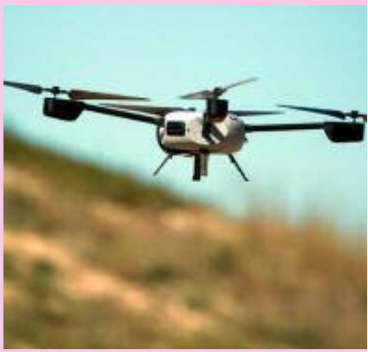
ਤਸਕਰਾਂ ਨੂੰ ਫੜਨ ਲਈ ਵੱਖ-ਵੱਖ ਚੌਕੀਆਂ 'ਤੇ ਨਜ਼ਰ ਰੱਖੀ ਜਾ ਰਹੀ ਹੈ।

ਨਵੀਂ ਦਿੱਲੀ । ਕੇਂਦਰੀ ਗ੍ਰਹਿ ਰਾਜ ਮੰਤਰੀ ਨਿਤਿਆਨੰਦ ਰਾਏ ਨੇ ਮੰਗਲਵਾਰ ਨੂੰ ਲੋਕ ਸਭਾ 'ਚ ਕਿਹਾ ਕਿ ਸੀਮਾ ਸੁਰੱਖਿਆ ਬਲ (ਬੀ.ਐਸ.ਐਫ.) ਨੇ 2024 'ਚ ਪੰਜਾਬ 'ਚ 294 ਡਰੋਨ ਜ਼ਬਤ ਕੀਤੇ ਹਨ। ਰਾਏ ਨੇ ਇਹ ਵੀ ਕਿਹਾ ਕਿ ਇਨ੍ਹਾਂ ਡਰੋਨਾਂ ਨਾਲ ਨਜਿੱਠਣ ਲਈ ਪੰਜਾਬ ਸਰਹੱਦ 'ਤੇ ਐਂਟੀ ਡਰੋਨ ਸਿਸਟਮ ਲਗਾਇਆ ਗਿਆ ਹੈ। ਉਨ੍ਹਾਂ ਕਿਹਾ, "ਵੱਖ-ਵੱਖ ਸਰੋਤਾਂ ਤੋਂ ਮਿਲੀ ਜਾਣਕਾਰੀ ਦੇ ਆਧਾਰ 'ਤੇ ਸੀਮਾ ਸੁਰੱਖਿਆ ਬਲ (ਬੀ.ਐਸ.ਐਫ.) ਨੇ 2024 'ਚ ਪੰਜਾਬ ਸਰਹੱਦ 'ਤੇ 294 ਡਰੋਨ ਜ਼ਬਤ ਕੀਤੇ ਹਨ।" ਮੰਤਰੀ ਨੇ ਕਿਹਾ ਕਿ ਡਰੋਨ ਰਾਹੀਂ ਤਸਕਰੀ ਦੇ ਖਤਰੇ ਨਾਲ ਨਜਿੱਠਣ ਲਈ ਕਈ ਕਦਮ ਚੁੱਕੇ ਗਏ ਹਨ ਜਿਵੇਂ ਕਿ ਐਂਟੀ ਡਰੋਨ ਸਿਸਟਮ ਸਥਾਪਤ ਕਰਨਾ, ਡਰੋਨ ਬਾਰੇ ਜਾਣਕਾਰੀ ਤੁਰਤ ਬੀ.ਐਸ.ਐਫ. ਹੈੱਡਕੁਆਰਟਰ, ਭਾਰਤੀ ਹਵਾਈ ਫ਼ੌਜ ਅਤੇ ਸਥਾਨਕ ਪੁਲਿਸ ਸਟੇਸ਼ਨਾਂ ਨਾਲ ਸਾਂਝੀ ਕਰਨਾ। ਉਨ੍ਹਾਂ ਕਿਹਾ ਕਿ ਦਿਨ-ਰਾਤ ਨਿਗਰਾਨੀ ਉਪਕਰਣਾਂ ਦੀ ਮਦਦ ਨਾਲ ਯੂ.ਏ.ਵੀ. ਅਤੇ ਡਰੋਨ 'ਤੇ ਨਜ਼ਰ ਰੱਖੀ ਜਾ ਰਹੀ ਹੈ, ਖੁਫੀਆ ਨੈੱਟਵਰਕ ਅਤੇ ਸਹਿਯੋਗੀ ਏਜੰਸੀਆਂ ਨਾਲ ਸਮੇਂ ਸਿਰ ਤਾਲਮੇਲ ਮਜ਼ਬੂਤ ਕੀਤਾ ਗਿਆ ਹੈ ਅਤੇ