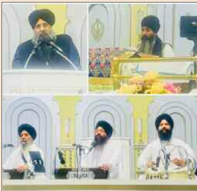
ਦੁਆਰਾ ਦਿੱਤੇ ਉਪਦੇਸ਼ ਉਤੇ ਚੱਲਦਿਆਂ ਅੰਮ੍ਰਿਤ ਛਕ ਕੇ ਸਿੰਘ