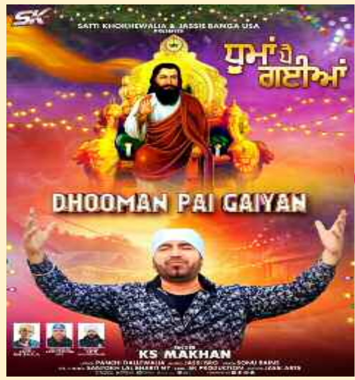
ਟੀਮ ਵੱਲੋਂ ਵੱਖ ਵੱਖ ਕਲਾਕਾਰਾਂ ਦਾ ਗੁਲਦਸਤਾ ਇਸ ਆਗਮਨ ਪੁਰਬ ਤੇ ਤਿਆਰ ਕੀਤਾ ਗਿਆ ਹੈ, ਜਿਨ੍ਹਾਂ ਨੂੰ ਇੱਕ ਇਕ ਕਰਕੇ ਲਾਂਚ ਕਰ ਦਿੱਤਾ