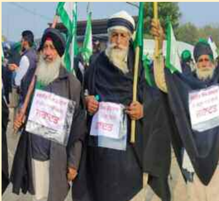
ਹਾਲਤ ਸਥਿਰ ਹੈ। ਜਸਟਿਸ ਸੂਰਿਆਕਾਂਤ ਅਤੇ ਜਸਟਿਸ ਐਨਕੇ ਸਿੰਘ ਦੇ ਬੈਂਚ ਸਾਹਮਣੇ ਪੰਜਾਬ ਸਰਕਾਰ ਵੱਲੋਂ ਪੇਸ਼ ਹੋਏ ਸੀਨੀਅਰ