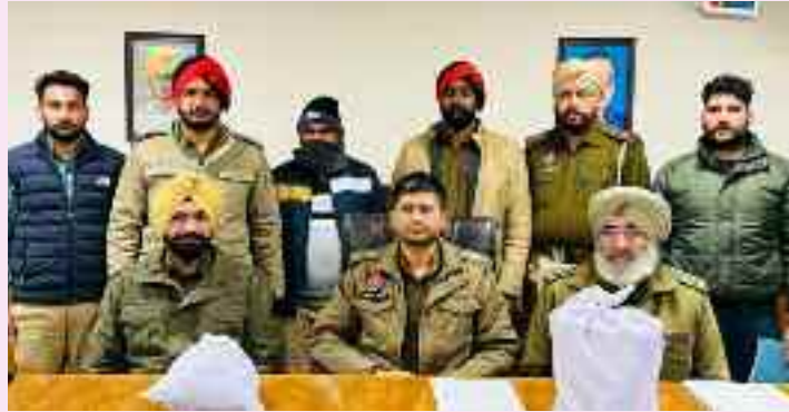
ਅਗਲੇ-ਪਿਛਲੇ ਸਬੰਧਾਂ ਦਾ ਪਤਾ ਲਗਾਉਣ ਲਈ ਅਗਲੇਰੀ ਜਾਂਚ ਕੀਤੀ ਜਾ ਰਹੀ ਹੈ। ਉਨ੍ਹਾਂ ਅੱਗੇ ਕਿਹਾ ਕਿ ਆਗਾਮੀ ਦਿਨਾਂ ਵਿੱਚ ਹੋਰ ਗ੍ਰਿਫਤਾਰੀਆਂ ਅਤੇ ਬਰਾਮਦਗੀਆਂ ਹੋਣ