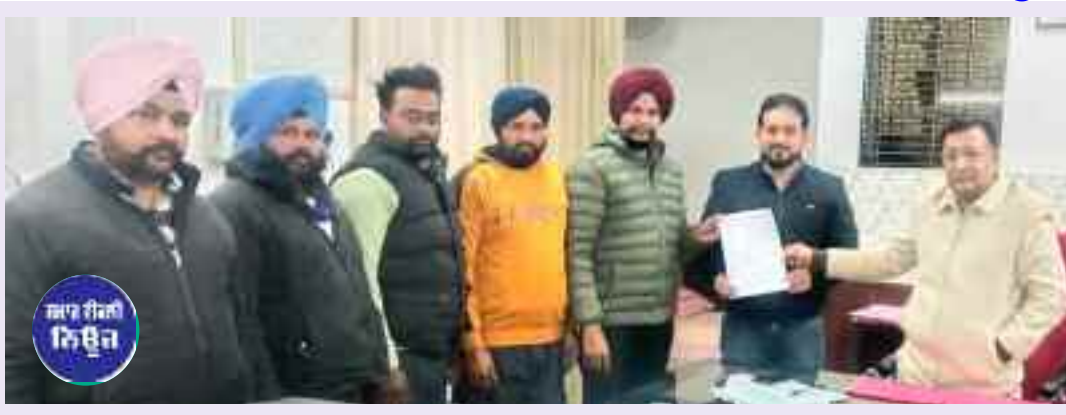
ਪਏ ਕਾਮੇ ਲਈ ਪੱਕੀ ਨੌਕਰੀ ਸਮੇਤ ਪੈਨਸ਼ਨ ਦਾ ਪ੍ਰਬੰਧ ਕਰਨ ਅਤੇ ਕਰੰਟ ਲੱਗਣ ਵਧੀਆ ਇਲਾਜ ਦਾ ਪ੍ਰਬੰਧ ਕਰਨ ਦੀ ਗੱਲ ਰੱਖੀ ਗਈ ਅਤੇ ਪਿਛਲੇ ਸਮੇਂ ਦੇ ਵਿੱਚ ਕੀਤੇ ਗਏ ਟੈਂਡਰਾਂ ਵਿੱਚ ਵੱਡੀਆਂ ਧਨਾਟ ਕੰਪਨੀਆਂ ਵੱਲੋਂ ਕਾਮਿਆਂ ਨੂੰ ਮਿਲਣ ਯੋਗ ਸਹੂਲਤਾਂ ਲਾਗੂ ਨਹੀਂ ਕੀਤੀਆਂ ਗਈਆਂ ਅਤੇ ਕਿਰਤ ਕਾਨੂੰਨਾਂ ਅਨੁਸਾਰ ਮਿਲਣ ਯੋਗ ਬਕਾਇਏ ਏਰੀਅਰ ਦੀ ਵੀ ਅਦਾਇਗੀ ਨਹੀਂ ਕੀਤੀ ਗਈ ਜਿਸ ਦੇ ਕਾਰਨ ਲਗਾਤਾਰ ਠੇਕਾ ਕਾਮਿਆਂ ਚ ਭਾਰੀ ਰੋਸ ਪਾਇਆ ਜਾ ਰਿਹਾ ਹੈ ਕਿ ਠੇਕੇਦਾਰੀ ਸਿਸਟਮ ਨੂੰ ਬੰਦ ਕਰ ਸਮੂਹ ਆਉਟ ਸੋਰਸਿੰਗ ਠੇਕਾ ਕਾਮਿਆਂ ਨੂੰ ਸਿੱਧਾ ਵਿਭਾਗ ਵਿੱਚ ਸ਼ਾਮਲ ਕਰਨ ਅਤੇ ਘੱਟੋ ਘੱਟ ਗੁਜ਼ਾਰੇ ਯੋਗ ਤਨਖਾਹ ਨਿਸ਼ਚਿਤ ਕਰਨ, ਬਿਜਲੀ ਦਾ ਕਰੰਟ ਲੱਗਣ ਕਾਰਨ ਮੌਤ ਦੇ ਮੂੰਹ ਪਏ ਕਾਮੇ ਨੂੰ ਪੱਕੀ ਨੌਕਰੀ ਪੈਨਸ਼ਨ ਦੀ ਗਰੰਟੀ ਕਰਨ ਸਮੇਤ ਮੰਗ ਪੱਤਰ ਵਿੱਚ ਦਰਜ ਮੰਗਾਂ ਨੂੰ ਹੱਲ ਕਰਨ ਦੀ ਮੰਗ ਕੀਤੀ। ਜਥੇਬੰਦੀ ਆਗੂਆਂ ਨੇ ਕਿਹਾ ਕਿ 16

ਨਵੇਂ ਟੈਂਡਰ ਜਾਰੀ ਕਰ ਰਹੀ ਹੈ ਜਿਸ ਦੇ ਤਹਿਤ ਬਿਜਲੀ ਸਪਲਾਈ ਨੂੰ ਬਹਾਲ ਰੱਖਣ ਲਈ ਆਉਟਸੋਰਸਿੰਗ ਰਾਹੀਂ ਸੀਐਚਬੀ ਕਾਮਿਆਂ ਦੀ ਭਰਤੀ ਲੰਮੇ ਸਮੇਂ ਤੋਂ ਕੀਤੀ ਗਈ ਹੈ, ਜੋ ਕਿ ਲਗਾਤਾਰ ਬਿਜਲੀ ਅਦਾਰੇ ਅੰਦਰ ਕੰਮ ਕਰ ਰਹੇ ਹਨ। ਪੰਜਾਬ ਸਰਕਾਰ ਅਤੇ ਪਾਵਰ ਕੌਮ ਦੀ ਮੈਨੇਜਮੈਂਟ ਨਾਲ ਸੀਐਚਬੀ ਤੇ ਡਬਲਿਊ ਅਤੇ ਸੀਐਚਐਚ ਕਾਮਿਆਂ ਦੀਆਂ ਮੰਗਾਂ ਨੂੰ ਲੈ ਕੇ ਲਗਾਤਾਰ ਮੀਟਿੰਗਾਂ ਦਾ ਸਿਲਸਿਲਾ ਚੱਲ ਰਿਹਾ ਹੈ। ਟੈਂਡਰਾਂ ਨੂੰ ਲੈ ਕੇ ਔਜ ਦੀ ਮੀਟਿੰਗ ਵਿੱਚ ਠੇਕਾ ਕਾਮਿਆਂ ਨੇ ਮੰਗ ਕੀਤੀ ਕਿ ਵੱਡੀਆਂ ਧਨਾਟ ਕੰਪਨੀਆਂ ਨੂੰ ਮੁਨਾਫਾ ਦੇਣ ਦੀ ਥਾਂ ਆਉਟਸੋਰਸਿੰਗ ਰਾਹੀਂ ਭਰਤੀ ਕੀਤੇ ਠੇਕਾ ਕਾਮਿਆਂ ਨੂੰ ਸਿੱਧਾ ਵਿਭਾਗ ਵਿੱਚ ਸ਼ਾਮਲ ਕਰਨ ਅਤੇ ਘੱਟੋ ਘੱਟ ਗੁਜ਼ਾਰੇ ਯੋਗ ਤਨਖਾਹ ਨਿਸ਼ਚਿਤ ਕਰਨ ਅਤੇ ਬਿਜਲੀ ਦਾ ਕਰੰਟ ਲੱਗਣ ਕਾਰਨ ਮੌਤ ਤੇ ਮੂੰਹ