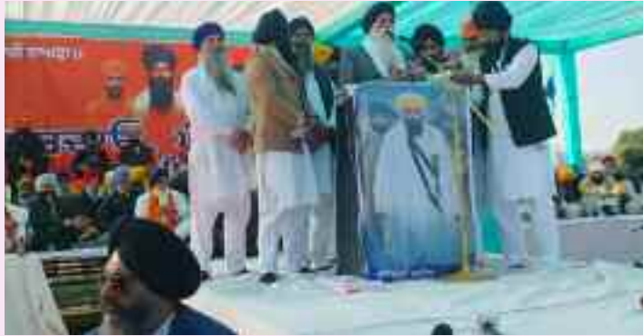
ਇਸੇ ਤਰ੍ਹਾਂ ਨਵੀਂ ਭਰਤੀ ਲਈ ਸੱਤ ਮੈਂਬਰ ਕਮੇਟੀ ਬਣਾਈ ਗਈ ਹੈ।