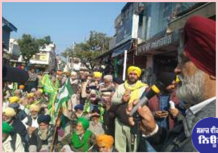
ਲੋਕ ਸਿੱਧਾ ਖਰੀਦਦਾਰੀ ਕਰਕੇ ਆਪਣੇ ਗਡਾਉਣ ਵਿੱਚ ਭੇਜਣਗੇ ਜਿਸ ਨਾਲ ਕੇ ਮੰਡੀ ਨਾਲ ਜੁੜੇ ਹੋਏ ਮਜ਼ਦੂਰ, ਆੜਤੀਏ ਅਤੇ ਹੋਰ ਛੋਟੇ ਮੋਟੇ ਕਿੱਤਿਆਂ ਵਾਲੇ ਲੋਕ ਬਿਲਕੁਲ ਬੇਰੁਜ਼ਗਾਰ ਹੋ ਜਾਣਗੇ। ਮੰਡੀਕਰਨ ਉੱਤੇ ਕਾਰਪੋਰੇਟਾਂ ਦੇ ਕਬਜ਼ੇ ਤੋਂ ਬਾਅਦ ਉਹ ਆਪਣੀ ਮਨ ਮਰਜ਼ੀ ਨਾਲ ਹੀ ਜਿਨਸਾ ਖਰੀਦਣਗੇ ਅਤੇ ਆਮ ਕਿਸਾਨ ਇਸ ਖੇਤੀਬਾੜੀ ਦੇ ਵਿੱਚੋਂ ਬਿਲਕੁਲ ਬਾਹਰ ਹੋ ਜਾਵੇਗਾ। ਸਾਰੇ ਬੁਲਾਰਿਆਂ ਨੇ ਇਸ

ਕੇਂਦਰ ਸਰਕਾਰ ਲਗਾਤਾਰ ਖੇਤੀ ਨਾਲ ਸੰਬੰਧਿਤ ਮੁੱਦਿਆਂ ਨੂੰ ਨਜ਼ਰ ਅੰਦਾਜ਼ ਕਰ ਰਹੀ ਹੈ ਅਤੇ ਸਮੁੱਚੇ ਖੇਤੀਬਾੜੀ ਸੈਕਟਰ ਨੂੰ ਕਿਸਾਨਾਂ ਤੋਂ ਖੋਹ ਕੇ ਕਾਰ-ਪੋਰੇਟ ਸੈਕਟਰ ਦੇ ਹਵਾਲੇ ਕਰਨਾ ਚਾਹੁੰਦੀ ਹੈ। ਉਨ੍ਹਾਂ ਸਮੁੱਚੇ ਸਮਾਜ ਨੂੰ ਇਸ ਜੀਵਨ ਨਾਲ ਜੁੜੇ ਮਹੱਤਵਪੂਰਨ ਖੇਤਰ ਨੂੰ ਬਚਾਉਣ ਲਈ ਇਕੱਠੇ ਹੋ ਕੇ ਸੰਘਰਸ਼ ਕਰਨ ਦੀ ਅਪੀਲ ਕੀਤੀ। ਖੇਤੀਬਾੜੀ ਲੋਕਾਂ ਦੇ ਜੀਵਨ ਦਾ ਆਧਾਰ ਹੈ ਲ ਖੇਤੀ ਸੈਕਟਰ ਨੂੰ ਵਿਕਾਸ ਦੇ ਏਜੰਡੇ ਵਿੱਚ ਪਹਿਲੀ ਥਾਂ ਦਿੱਤੀ ਜਾਵੇ ਨਵੇਂ ਖੇਤੀਬਾੜੀ ਖਰੜੇ ਦੇ ਸੰਬੰਧ ਵਿੱਚ ਬੋਲਦਿਆਂ ਬੁਲਾਰਿਆਂ ਨੇ ਕਿਹਾ ਕਿ ਸਾਰਾ ਖੇਤੀਬਾੜੀ ਖਰੜਾ ਹੀ ਕਾਰਪੋਰੇਟ ਘਰਾਣਿਆਂ ਦੇ ਪੱਖ ਵਿੱਚ ਹੈ। ਮੁਕਾਬਲੇਬਾਜ਼ੀ ਵਿੱਚ ਸਿਰਫ ਕਾਰਪੋਰੇਟ ਘਰਾਣਿਆਂ ਦਾ ਹੀ ਬੋਲਬਾਲਾ ਹੋਵੇਗਾ। ਮੌਜੂਦਾ ਮੰਡੀਕਰਨ ਬਿਲਕੁਲ ਖਤਮ ਹੋ ਜਾਵੇਗਾ ਤੇ ਵੱਡੇ