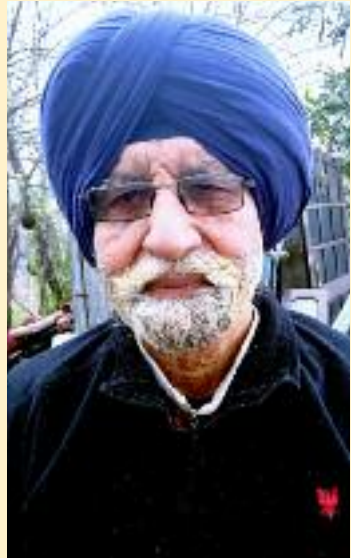
ਮਤਾ ਪਾਸ ਕੀਤਾ ਗਿਆ ਤਾਂ ਜੋ ਸਿੰਘ ਸਾਹਿਬ ਗਿਆਨੀ

ਹਰਪ੍ਰੀਤ ਸਿੰਘ ਨੂੰ ਸ੍ਰੀ ਅਕਾਲ ਤਖਤ ਸਾਹਿਬ ਤੋਂ ਦਿੱਤੇ ਫੈਸਲੇ ਦੀ ਸਜ਼ਾ ਦਿੱਤੀ ਜਾ ਸਕੇ ਸਾਰੀਆਂ ਪੰਥਕ ਸੰਸਥਾਵਾਂ ਤੇ ਗੁਰੂ ਨਾਨਕ ਨਾਮ ਲੇਵਾ ਸੰਗਤਾਂ ਵੱਲੋਂ ਉਸਦਾ ਬਹੁਤ ਬੁਰਾ ਮਨਾਇਆ ਗਿਆ ਸ੍ਰੀ ਅਕਾਲ ਤਖਤ ਸਾਹਿਬ ਦੇ ਜਥੇਦਾਰ ਗਿਆਨੀ ਰਘਵੀਰ ਸਿੰਘ ਵਲੋਂ ਵੀ ਇਸ ਕਾਰਵਾਈ ਦੀ ਨਿਖੇਧੀ ਕੀਤੀ ਗਈ ਫਿਰ ਵੀ ਬਾਦਲ ਟੋਲੀ ਨੂੰ ਸਮਝ ਨਹੀਂ ਆਈ ਸਗੋਂ ਸੁਖਬੀਰ ਸਿੰਘ ਬਾਦਲ ਦਾ ਅਸਤੀਫਾ ਪ੍ਰਵਾਨ ਕਰਕੇ ਭੇਜਣ ਵਿੱਚ ਕਈ ਦਿਨ ਆਨਾ ਕਾਨੀ ਕੀਤੀ ਗਈ ਤੇ