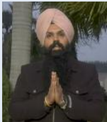
ਚੱਲੀ ਤਾਂ ਉੱਥੇ ਜੋ ਕੁਝ ਵਾਪਰਿਆ ਉਹ ਹੈਰਾਨ ਕਰਨ ਵਾਲਾ ਸੀ ਆਪ ਨਾਲ

ਮਾਛੀਵਾੜਾ ਨਗਰ ਕੌਂਸਲ ਦੀਆਂ ਨਾਮਜ਼ਦਗੀ ਪੱਤਰ ਵਾਲੇ ਦਿਨ ਹੀ ਵੱਡੀ ਗਿਣਤੀ ਦੇ ਵਿੱਚ ਆਪਣੇ ਵਿਰੋਧੀਆਂ ਦੇ ਕਾਗਜ਼ ਰੱਦ ਕਰ ਦਿੱਤੇ। ਉਸ ਮੌਕੇ ਅਕਾਲੀ ਦਲ ਕਾਂਗਰਸ ਭਾਜਪਾ ਨੇ ਧਰਨਾ ਪ੍ਰਦਰਸ਼ਨ ਕੀਤਾ ਤੇ ਗੱਲ ਹਾਈਕੋਰਟ ਤੱਕ ਜਾਣ ਦੀ ਵੀ ਕਹੀ ਫਿਰ ਚੋਣਾਂ ਹੋਈਆਂ ਜਿਸ ਵਿੱਚ ਚਾਰ ਸੀਟਾਂ ਆਪ ਨੇ ਜਿੱਤੀਆਂ ਦੇ ਅਕਾਲੀ ਤੇ ਦੋ ਕਾਂਗਰਸੀ ਉਸ ਤੋਂ ਬਾਅਦ ਜਦੋਂ ਕੱਲ ਪ੍ਰਧਾਨਗੀ ਦੀ ਗੱਲ