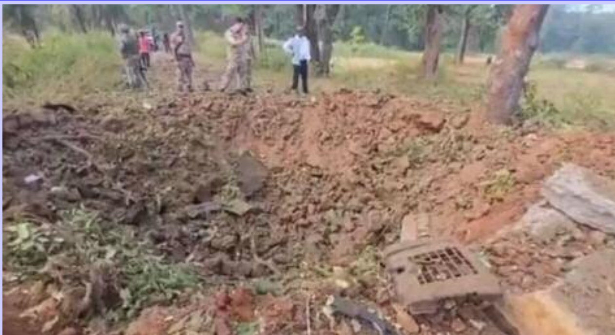
ਇੱਠਪੁਰਾ ਤੇ ਬੀਜਾਪੁਰ ਜ਼ਿਲ੍ਹਿਆਂ ਦੀ ਸਾਂਝੀ ਟੀਮ ਨੂੰ ਨਕਸਲ ਵਿਰੋਧੀ ਮੁਹਿੰਮ ਲਈ ਰਵਾਨਾ ਕੀਤਾ ਗਿਆ

ਬੀਜਾਪੁਰ। ਛੱਤੀਸਗੜ੍ਹ ਦੇ ਨਕਸਲ ਪ੍ਰਭਾਵਿਤ ਬੀਜਾਪੁਰ ਜ਼ਿਲ੍ਹੇ ਵਿੱਚ ਨਕਸਲੀਆਂ ਨੇ ਅੱਜ ਬਾਰੂਦੀ ਸੁਰੰਗ ਵਿੱਚ ਧਮਾਕਾ ਕਰ ਕੇ ਸੁਰੱਖਿਆ ਬਲਾਂ ਦੇ ਵਾਹਨ ਨੂੰ ਉਡਾ ਦਿੱਤਾ। ਇਸ ਹਮਲੇ ਵਿੱਚ ਅੱਠ ਜਵਾਨਾਂ ਸਣੇ ਨੌਂ ਵਿਅਕਤੀਆਂ ਦੀ ਮੌਤ ਹੋ ਗਈ। ਪੁਲੀਸ ਨੇ ਇਹ ਜਾਣਕਾਰੀ ਦਿੱਤੀ। ਪੁਲੀਸ ਅਧਿਕਾਰੀਆਂ ਨੇ ਦੱਸਿਆ ਕਿ ਜ਼ਿਲ੍ਹੇ ਦੇ ਕੁਟਰੂ ਥਾਣਾ ਖੇਤਰ ਅਧੀਨ ਅੰਬੋਲੀ ਪਿੰਡ ਦੇ ਨੇੜੇ ਨਕਸਲੀਆਂ ਨੇ ਬਾਰੂਦੀ ਸੁਰੰਗ ਵਿੱਚ ਧਮਾਕਾ ਕਰ ਕੇ ਸੁਰੱਖਿਆ ਬਲਾਂ ਦੇ ਵਾਹਨ ਨੂੰ ਉਡਾ ਦਿੱਤਾ। ਉਨ੍ਹਾਂ ਦੱਸਿਆ ਕਿ ਇਸ ਘਟਨਾ ਵਿੱਚ ਦਾਂਤੇਵਾੜਾ ਜ਼ਿਲ੍ਹਾ ਰਿਜ਼ਰਵ ਗਾਰਡ (ਡੀਆਰਜੀ) ਦੇ ਅੱਠ ਜਵਾਨ ਸ਼ਹੀਦ ਹੋ ਗਏ ਹਨ ਅਤੇ ਵਾਹਨ ਚਾਲਕ ਦੀ ਵੀ ਮੌਤ ਹੋ ਗਈ ਹੈ। ਅਧਿਕਾਰੀਆਂ ਨੇ ਦੱਸਿਆ ਕਿ ਦਾਂਤੇਵਾੜਾ, ਨਾਰ-