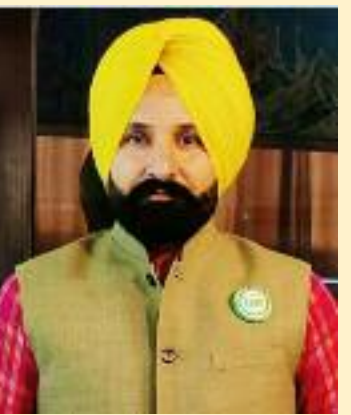
ਰਾਜਸਥਾਨ, ਹਿਮਾਚਲ, ਦਿੱਲੀ, ਪੂਰੇ ਭਾਰਤ ਅਤੇ ਐਨ ਆਰ ਆਈ ਵੀਰਾਂ ਨੂੰ ਅਪੀਲ ਕਰਦਿਆਂ ਕਿਹਾ