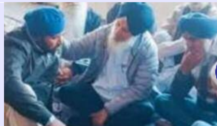
ਕੀਤੀਆਂ ਗਈਆਂ ਔਰ ਕਰੀਮਪੁਰੀ ਸਾਹਿਬ ਵੱਲੋ