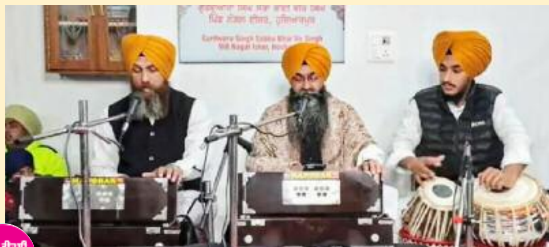
ਸਮਾਗਮ ਦੀ ਸ਼ੁਰੂਆਤ ਨਿਉਂਜ