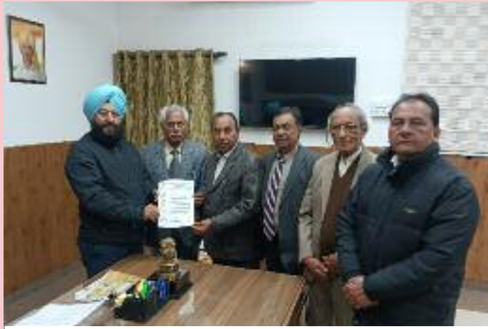
ਮਾਨਯੋਗ ਰਾਸ਼ਟਰਪਤੀ ਦੇ ਨਾਮ ਮਾਨਯੋਗ ਡਿਪਟੀ ਕਮਿਸ਼ਨਰ ਜਲੰਧਰ ਨੂੰ ਮੈਮੋਰੈਂਡਮ ਸੌਂਪਦੇ ਹੋਏ ਅੰਬੇਡਕਰ ਭਵਨ ਟਰੱਸਟ ਅਤੇ ਅੰਬੇਡਕਰ ਮਿਸ਼ਨ ਸੁਸਾਇਟੀ ਪੰਜਾਬ ਦੇ ਆਗੂ।

ਮਜ਼ਾਕੀਆ ਢੰਗ ਨਾਲ ਭੱਦੀ ਟਿੱਪਣੀ ਕੀਤੀ। ਦੇਸ਼-ਵਿਦੇਸ਼ ਵਿੱਚ ਬੈਠੇ ਬਾਬਾ ਸਾਹਿਬ ਡਾ. ਅੰਬੇਡਕਰ ਦੇ ਸ਼ਰਧਾਲੂਆਂ ਨੂੰ ਇਸ ਟਿੱਪਣੀ ਨੇ ਭਾਰੀ ਠੇਸ ਪਹੁੰਚਾਈ ਹੈ ਅਤੇ ਅਸੀਂ ਇਸ ਨੂੰ ਬਾਬਾ ਸਾਹਿਬ ਦਾ ਅਪਮਾਨ ਸਮਝਦੇ ਹਾਂ ਜੋ ਕਿਸੇ ਕੀਮਤ ਤੇ ਵੀ ਬਰਦਾਸ਼ਤ ਨਹੀਂ ਕੀਤਾ ਜਾਵੇਗਾ। ਇਸ ਲਈ ਅੰਬੇਡਕਰ ਭਵਨ ਟਰੱਸਟ (ਰਜਿ.) ਜਲੰਧਰ ਦੇ ਟਰੱਸਟੀਆਂ ਅਤੇ ਅੰਬੇਡਕਰ ਮਿਸ਼ਨ ਸੁਸਾਇਟੀ ਪੰਜਾਬ