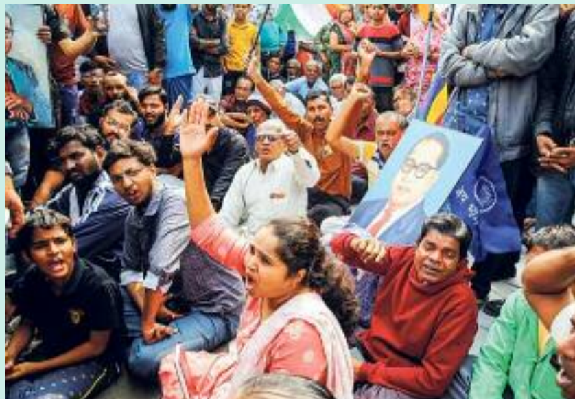
ਅਹਿਮਦਾਬਾਦ 'ਚ ਮੂਰਤੀ ਦੀ ਭੰਨ-ਤੋੜ ਖ਼ਿਲਾਫ਼ ਭੀਮ ਸੈਨਾ ਦੇ ਮੈਂਬਰ ਤੇ ਆਮ ਲੋਕ ਪ੍ਰਦਰਸ਼ਨ ਕਰਦੇ ਹੋਏ।

ਦੀ ਫੁਟੇਜ ਦੀ ਜਾਂਚ ਕਰਨੀ ਸ਼ੁਰੂ ਕਰ ਦਿੱਤੀ ਹੈ। ਪੁਲੀਸ ਅਧਿਕਾਰੀ ਨੇ ਕਿਹਾ, 'ਕੁਝ ਅਣਪਛਾਤੇ ਵਿਅਕਤੀਆਂ ਨੇ ਅਹਿਮਦਾਬਾਦ ਸ਼ਹਿਰ ਦੇ ਖੋਖਰਾ ਇਲਾਕੇ ਵਿੱਚ ਸ੍ਰੀ ਕੇਕੇ ਸ਼ਾਸਤਰੀ ਕਾਲਜ ਦੇ ਸਾਹਮਣੇ ਸਥਿਤ ਬਾਬਾ ਸਾਹਿਬ ਅੰਬੇਡਕਰ ਦੀ ਮੂਰਤੀ ਦੇ ਨੱਕ ਅਤੇ ਐਨਕਾਂ ਨੂੰ ਨੁਕਸਾਨ ਪਹੁੰਚਾਇਆ ਹੈ। ਉਨ੍ਹਾਂ ਦੱਸਿਆ ਕਿ ਇਹ ਘਟਨਾ ਅੱਜ ਸਵੇਰੇ 8 ਵਜੇ ਤੋਂ ਪਹਿਲਾਂ ਵਾਪਰੀ। ਇਸ ਸਬੰਧੀ ਬੀਐੱਨਐੱਸ ਦੀ ਧਾਰਾ 196 ਅਤੇ 298 ਤਹਿਤ ਅਣਪਛਾਤੇ ਵਿਅਕਤੀਆਂ